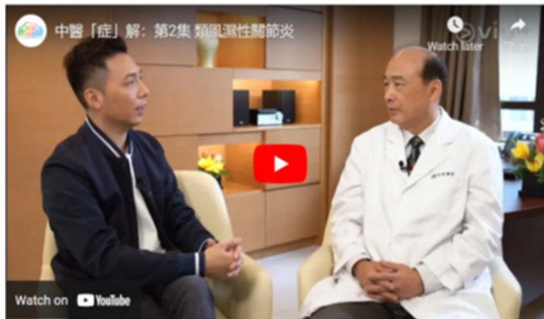
ViuTV - 中醫「症」解系列