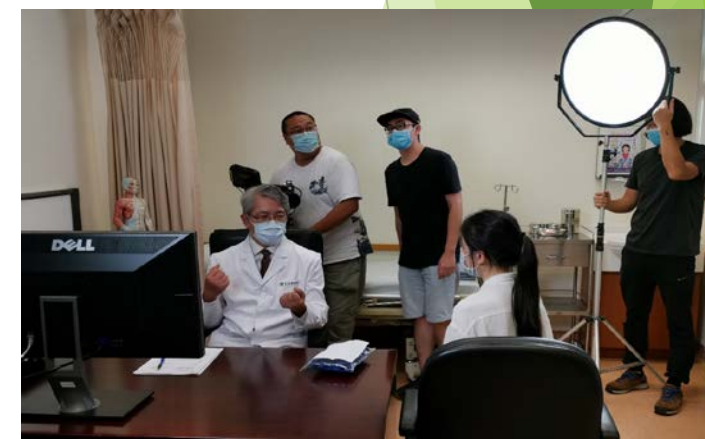
浸大中醫在線系列