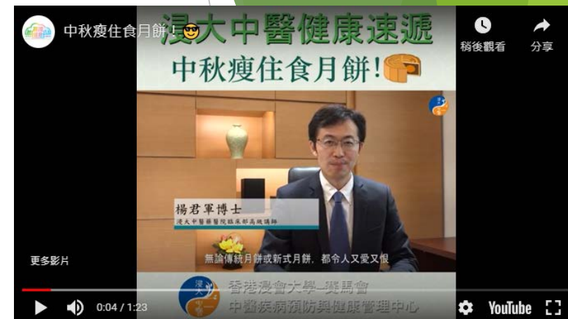
浸大中醫健康速遞系列