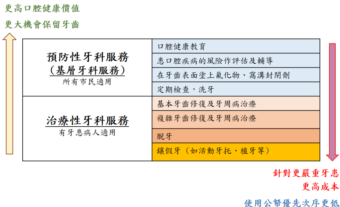
圖一：基層牙科服務的定義

5. 個人日常口腔衛生習慣和有助保持口腔健康的生活模式，是促進口腔健康必要的一環，衛生署向公眾建議有助保持口腔健康的生活模式，列於本報告附件二以供參考。工作小組認為政府應該透過圖一所示的基層牙科服務，協助及促進各年齡層的市民執行有助保持口腔健康的生活模式。長遠而言，將公共資源投放在基層牙科服務，比投放在治療性牙科服務有更大機會達致提升市民口腔健康整體水平。